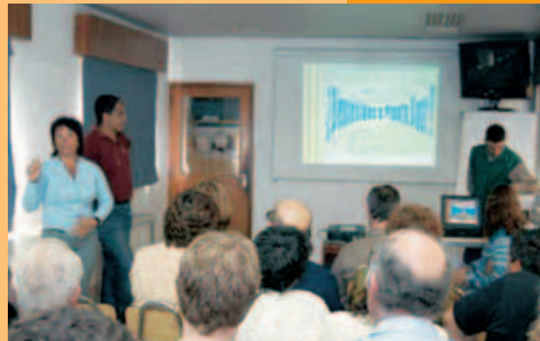
SIPAR, NA ARGENTINA, PROMOVE INTEGRAÇÃO COM COLABORADORES, FAMILIARES E COMUNIDADE DE PÉREZ

A prioridade social da Sipar, laminadora localizada na Argentina, é atuar junto a instituições e à população do município de Pérez – uma cidade de 22 mil habitantes, onde a empresa está localizada. O Grupo Gerdau possui 38,2% de participação no capital social da Sipar. Entre as ações para a comunidade que a unidade coloca em prática, destacam-se o apoio aos prestadores de serviços públicos, como polícia e bombeiros, e à própria prefeitura, além da manutenção de uma praça e ciclovia. A empresa também contribui com o desenvolvimento das escolas locais e com entidades beneficentes, como a Cruz Vermelha, a Liga de Ayuda contra el Cáncer (Lalcec), a Ilar, instituição voltada para a reabilitação de pessoas com necessidades especiais, e a Asociación Rosarina de Lucha contra la Poliomieltis (ARLPI).