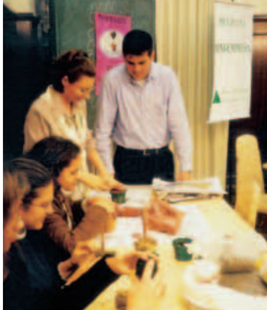
INTEGRANTES DA JUNIOR ACHIEVEMENT: PROJETO INTERNACIONAL DIFUNDE PRÁTICAS DE EMPREENDEDORISMO PARA MAIS DE 4 MILHÕES DE JOVENS NO MUNDO E CONTA COM O APOIO DO GRUPO GERDAU