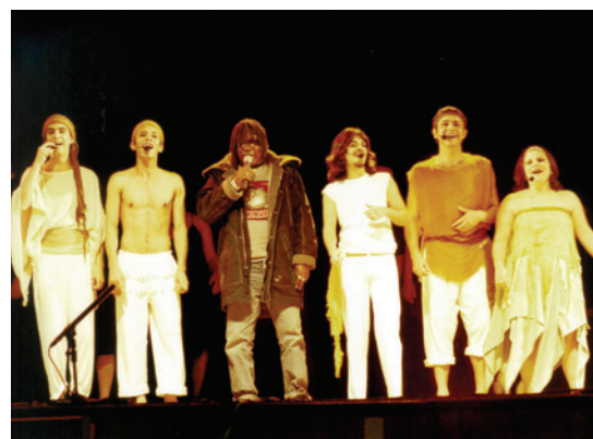
A UNIVERSIDADE DE MÚSICA BITUCA, EM BARBACENA (MG), FORMA GRATUITAMENTE MÚSICOS E ARTISTAS