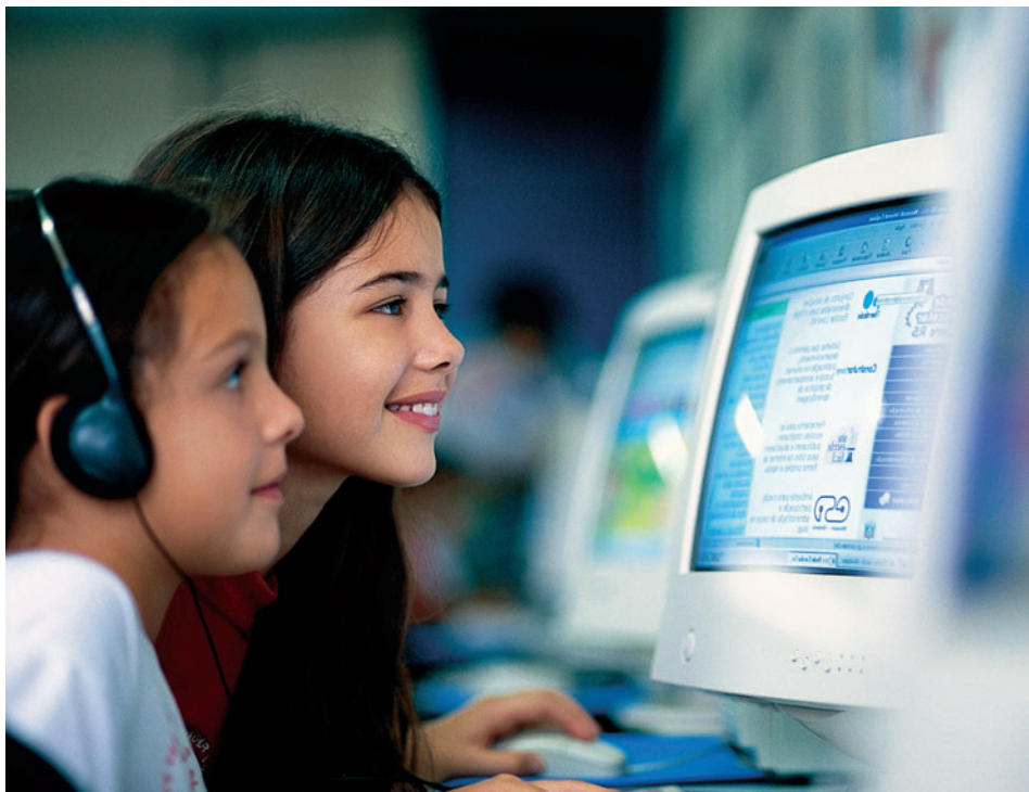
ALUNOS DA ESCOLA ESTADUAL DE ENSINO FUNDAMENTAL PIRATINI (RS) SÃO BENEFICIADOS POR PROGRAMA DO GRUPO GERDAU