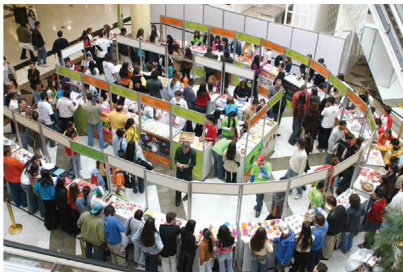
A FEIRA DE MINIEMPRESAS DA JUNIOR ACHIEVEMENT REUNIU MAIS DE 600 ESTUDANTES EM PORTO ALEGRE (RS)

Atender aos problemas emergenciais das comunidades em que atua, principalmente nas áreas de alimentação e moradia. Esses são os focos dos projetos de mobilização solidária do Grupo Gerdau. São campanhas que beneficiam a comunidade com alimentos, roupas, brinquedos, equipamentos de informática, entre outros itens.