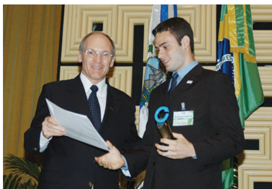
ALÉM DO TOP EMPRESARIAL (RJ), O GRUPO GERDAU APÓIA MAIS SETE PRÊMIOS DE RECONHECIMENTO À COMPETITIVIDADE DAS MICRO E PEQUENAS EMPRESAS EM VÁRIAS REGIÕES DO BRASIL

O Grupo Gerdau acredita que o trabalho voluntário é capaz de transformar realidades. Ao estabelecer uma atitude de solidariedade, o indivíduo reforça seus conceitos de cidadania e passa a ter uma dimensão mais ampla do outro, à medida que começa a interagir com a comunidade. Além disso, do ponto de vista econômico, o trabalho voluntário é uma das soluções mais eficientes para a modificação do cenário social, no qual é preciso atender às necessidades básicas dos indivíduos com recursos escassos. Seguindo essa filosofia, o Grupo Gerdau apóia entidades e incentiva a prática do voluntariado entre os seus colaboradores.