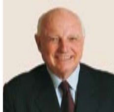
Jorge Gerdau Johannpeter