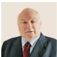
Germano H. Gerdau Johannpeter

Nascido em 1936, é graduado em Ciências Jurídicas e Sociais pela Universidade Federal do Rio Grande do Sul. Trabalha no Grupo Gerdau desde 1954, onde começou como auxiliar. Desde 1983 é presidente-executivo e presidente do Conselho de Administração.